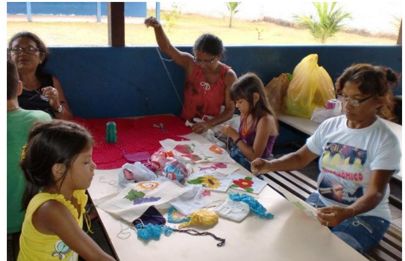
ARTE DO FUXICO