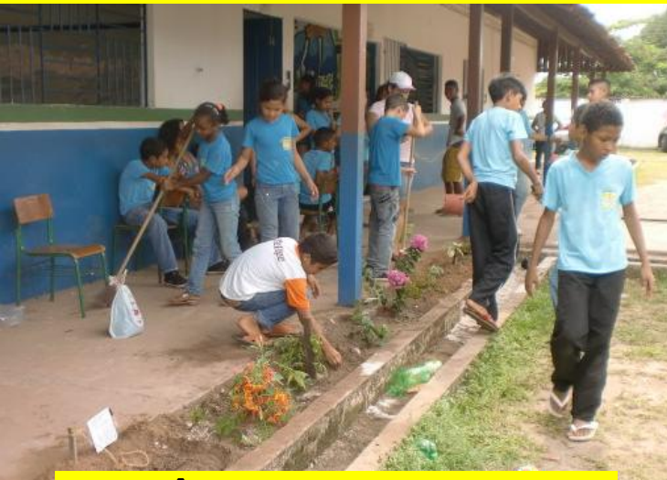
AÇÃO PLANTE MUDAS