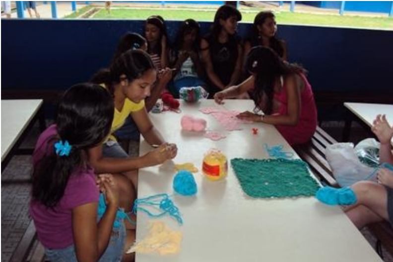
ARTE DO CROCHÊ