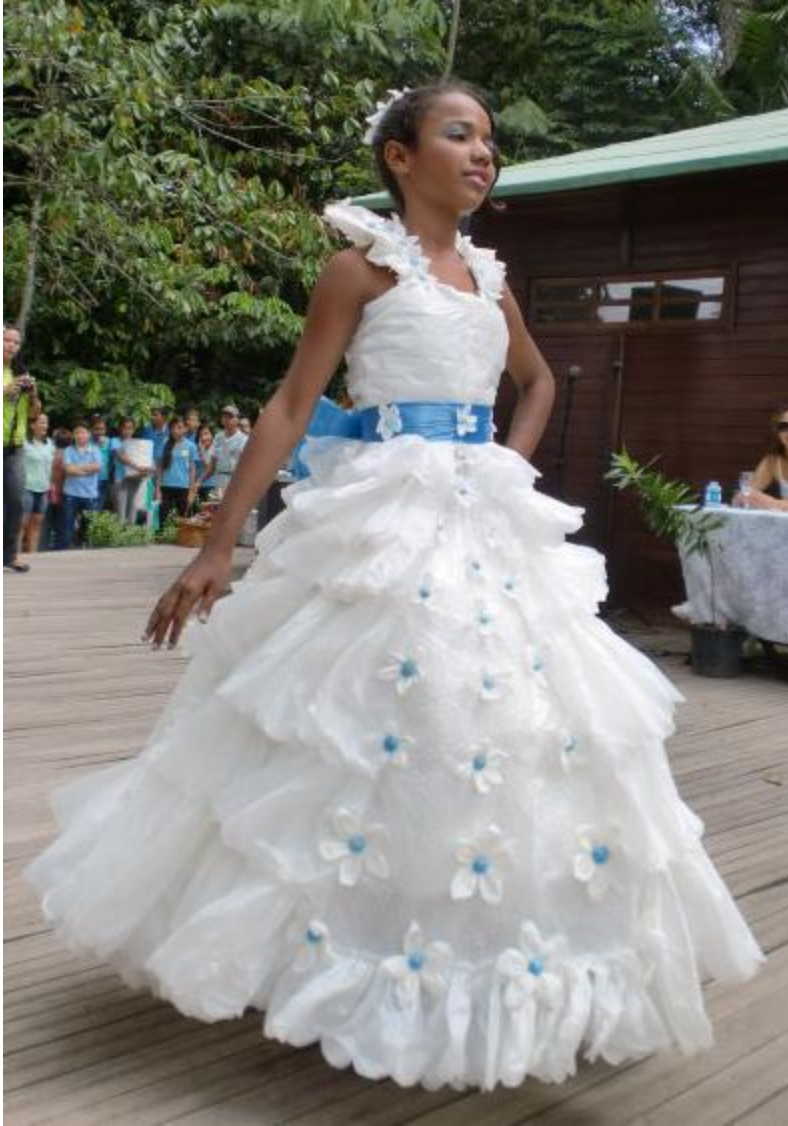
VESTIDO ARTE RECICLADO