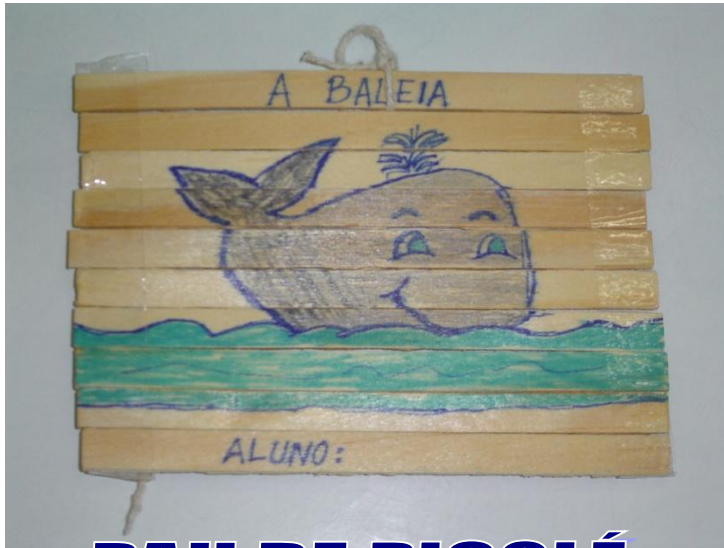
PAU DE PICOLÉ