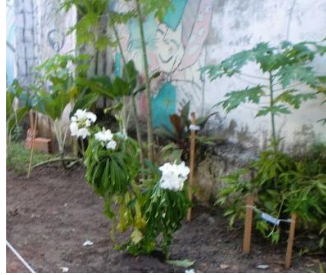
PLANTIL DE MUDAS