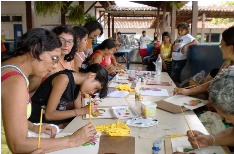
ARTE DA PINTURA