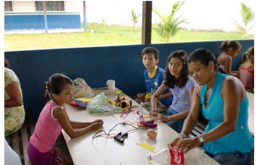
ARTE DA RECICLAGEM