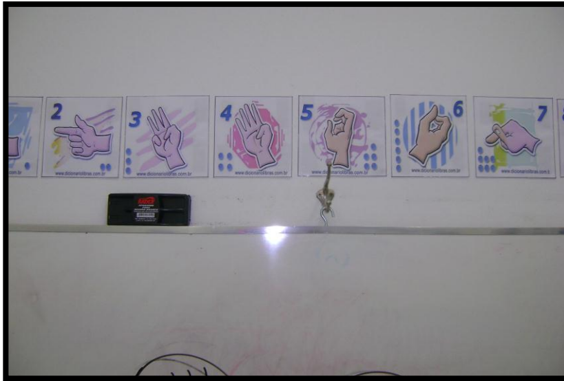
Números em LIBRAS