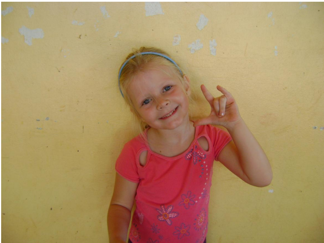
Colega ouvinte fazendo o Sinal Universal EU TE AMO.