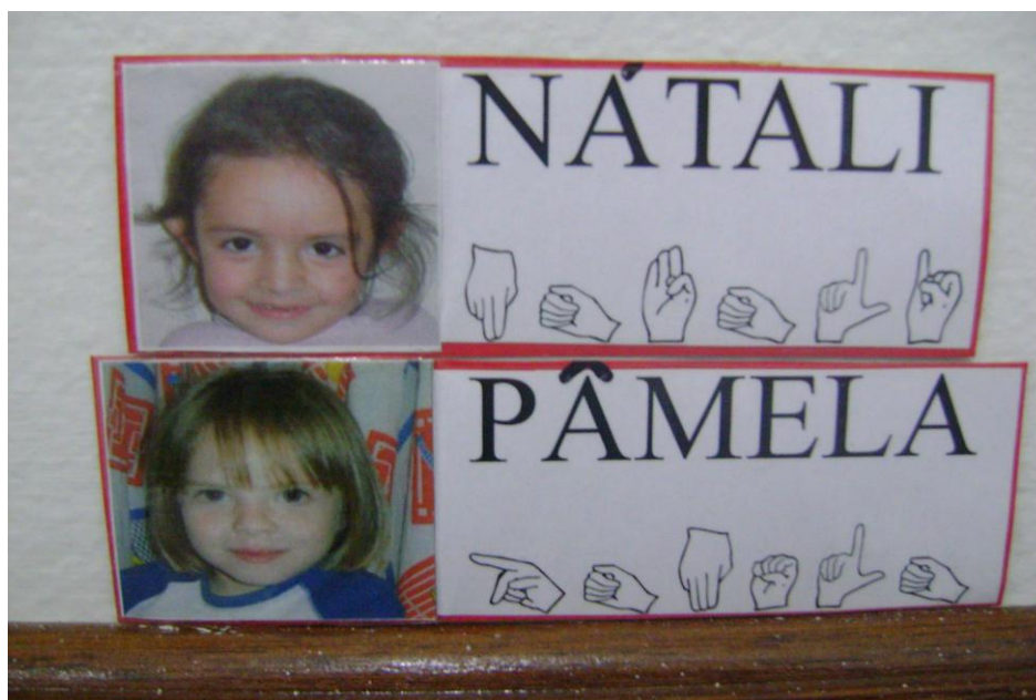
Identificação dos colegas.