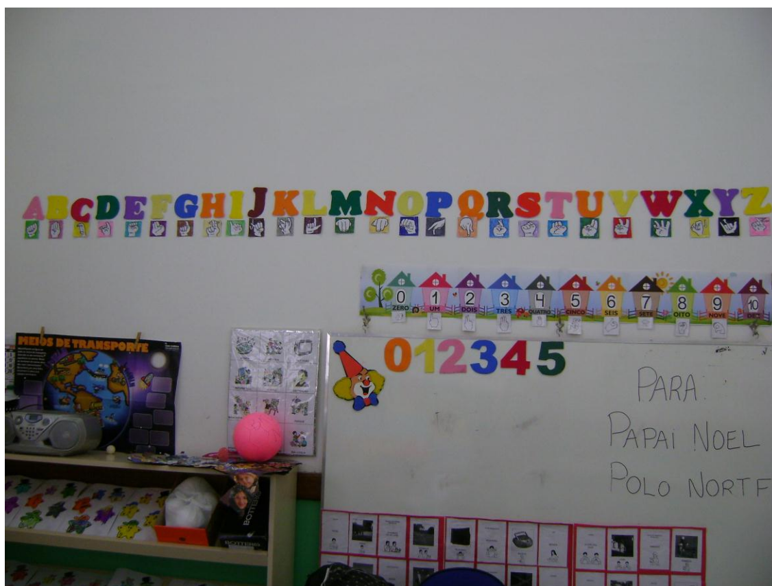
Alfabeto em LIBRAS e Português