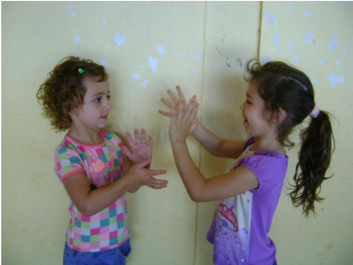
Colegas fazendo o sinal de LIBRAS.