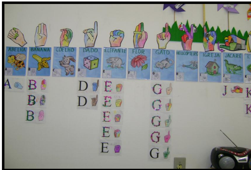
Alfabeto e Letras dos nomes.