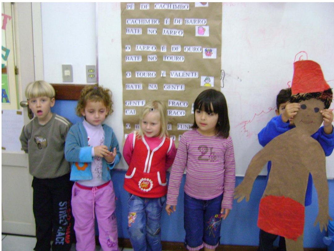
Trabalhando o Folclore Brasileiro.