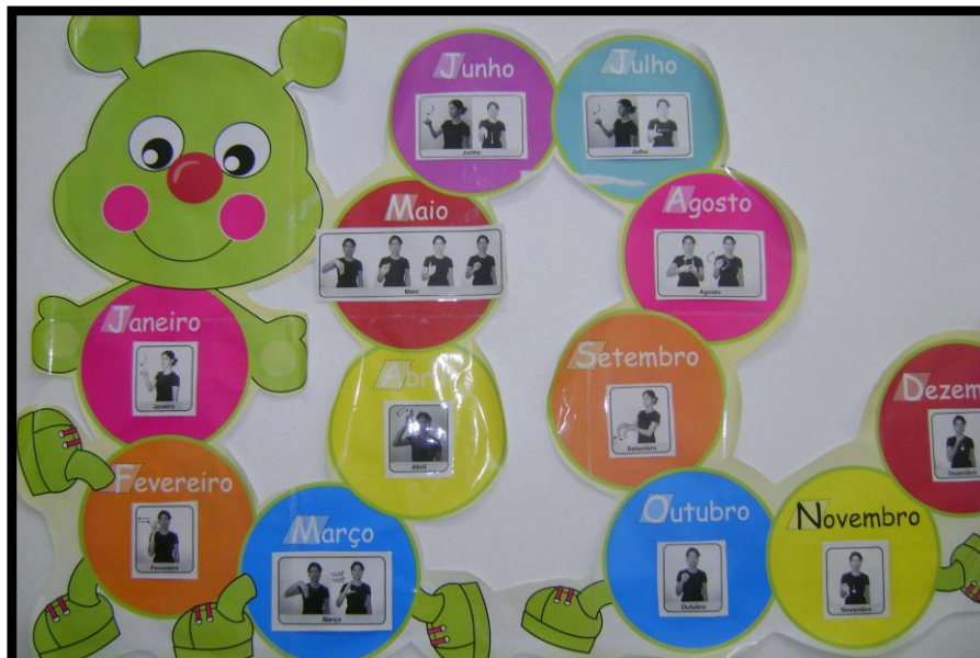
Adaptação dos calendários.