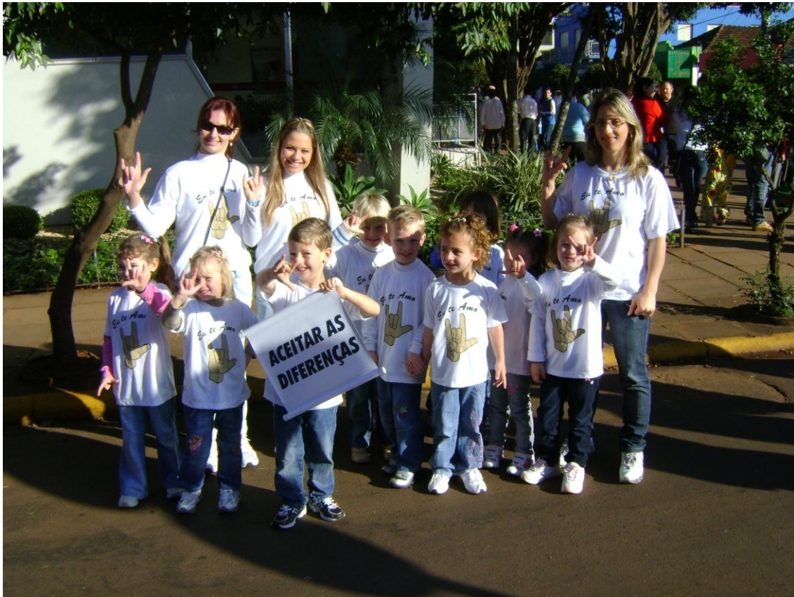
Participando de eventos da comunidade. Desfile Cívico 07 de setembro.