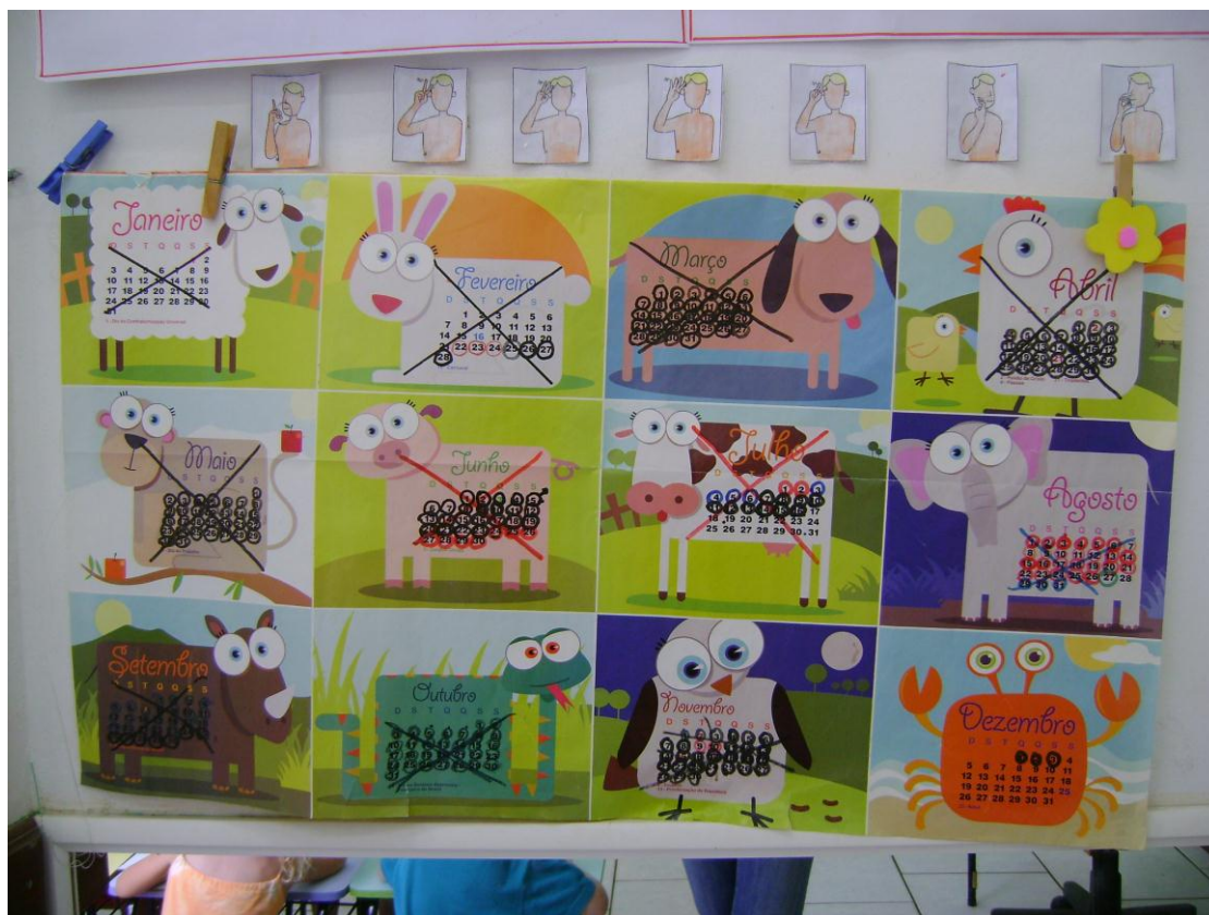
Adaptação na sala de aula