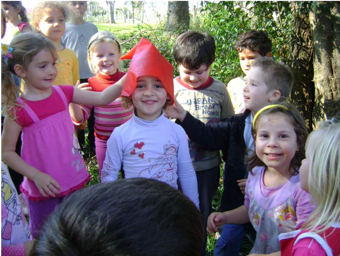
Caça ao Gorro do Saci.