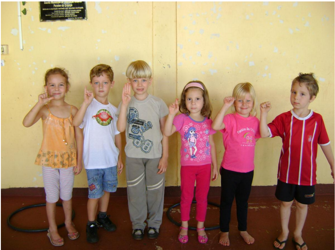
Alunos ouvintes fazendo a palavra LIBRAS com o alfabeto manual.