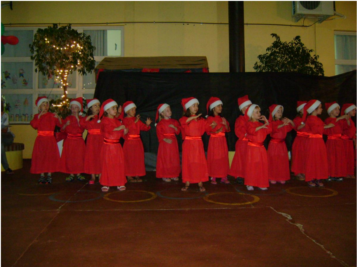
Apresentação de Natal: Noite Feliz em LIBRAS.