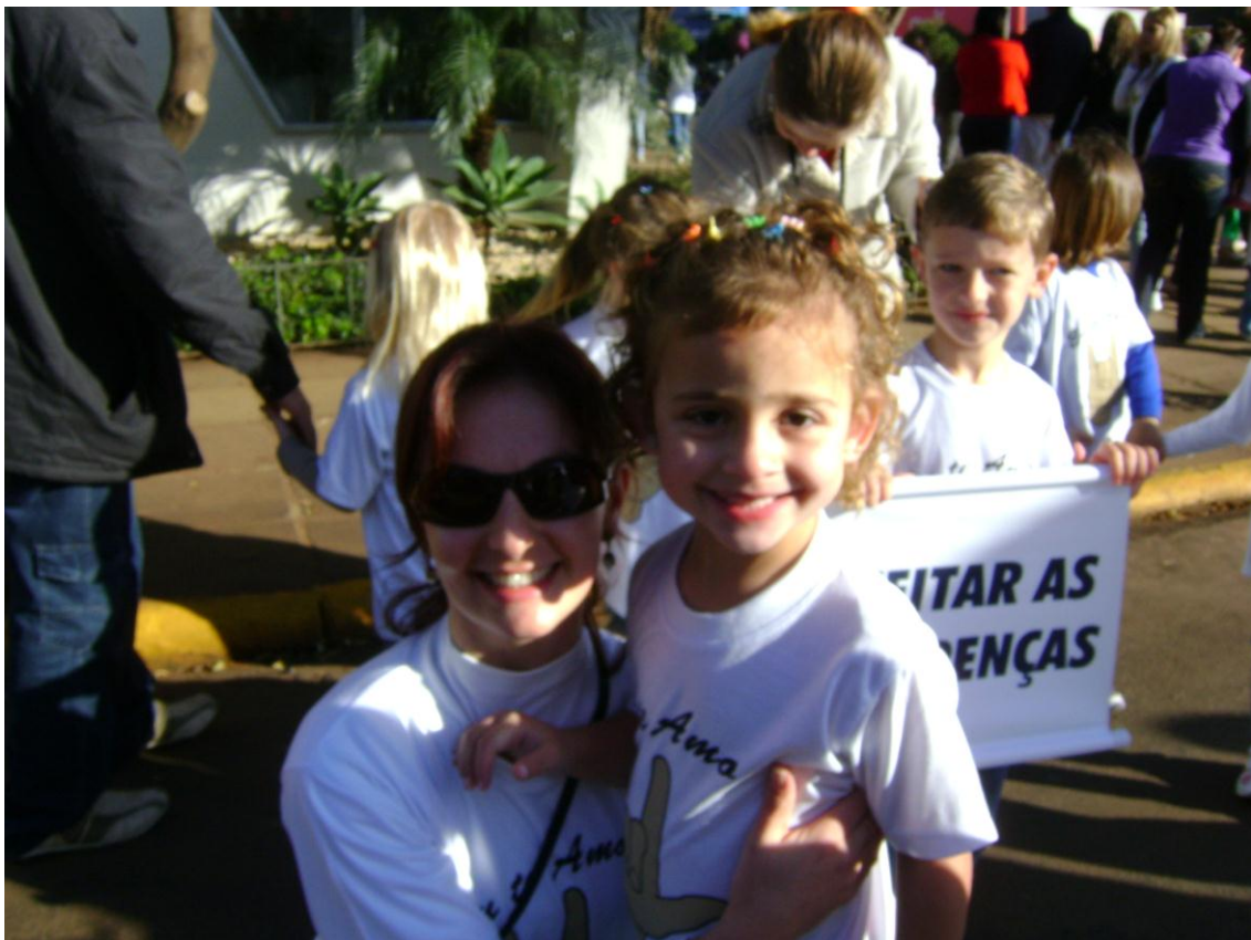
Professora e aluna surda, felizes com a LIBRAS.