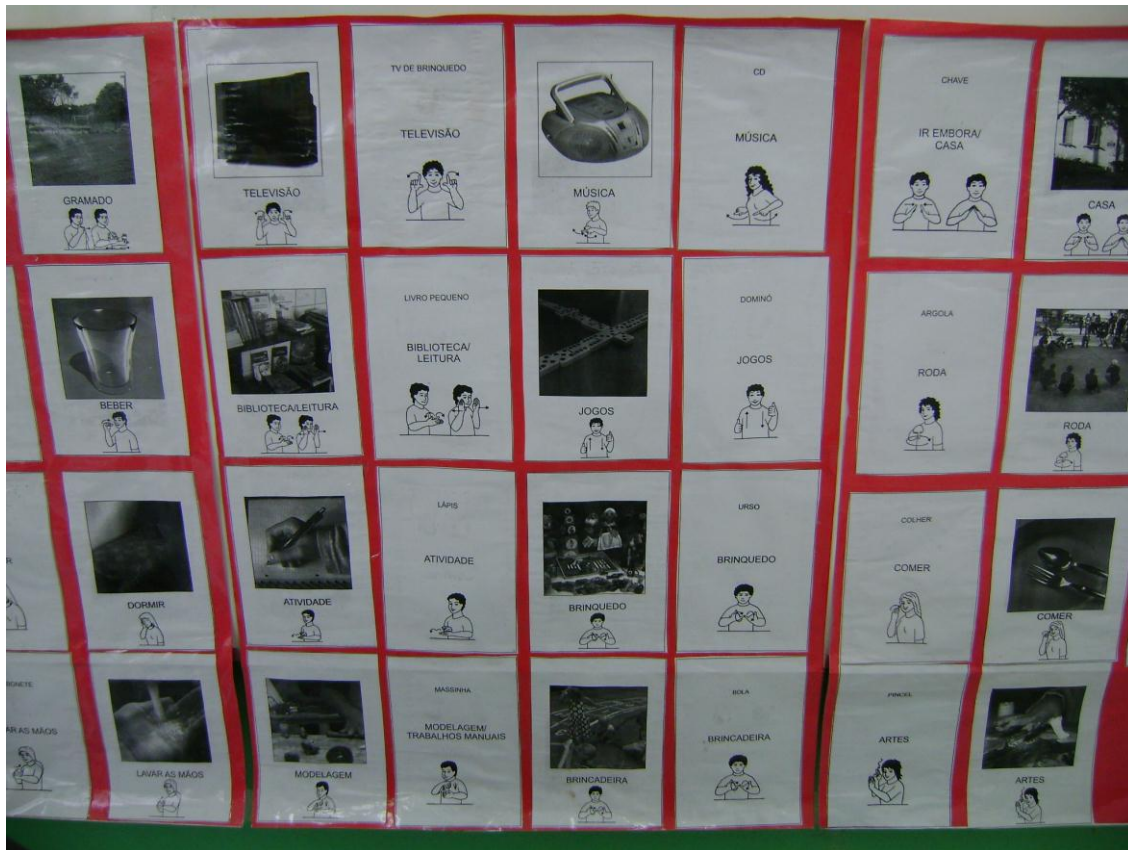
Sinais na sala do cotidiano escolar.