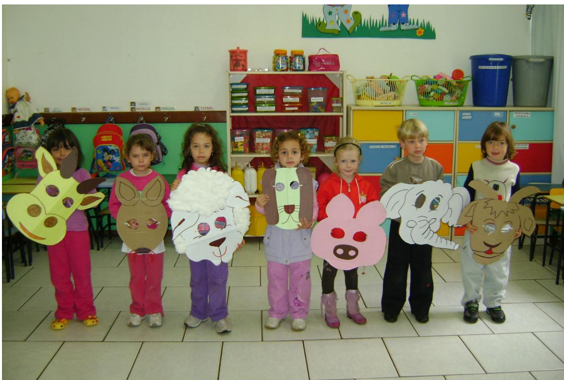
Dramatização de Histórias e adaptação para a LIBRAS.