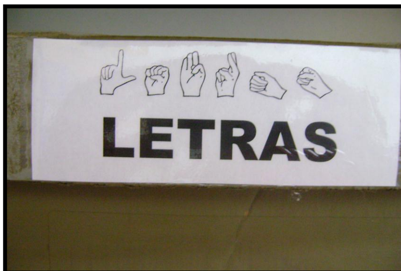
Identificação do Material na sala.