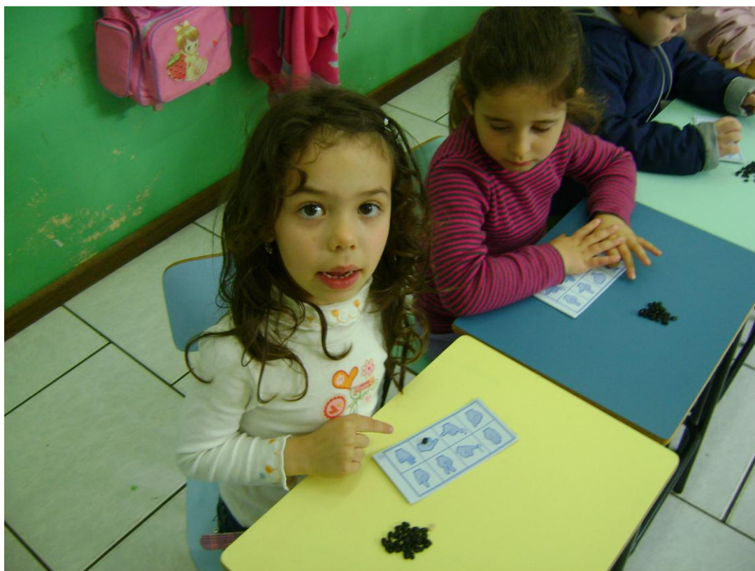
Jogo do Bingo das Letras em LIBRAS