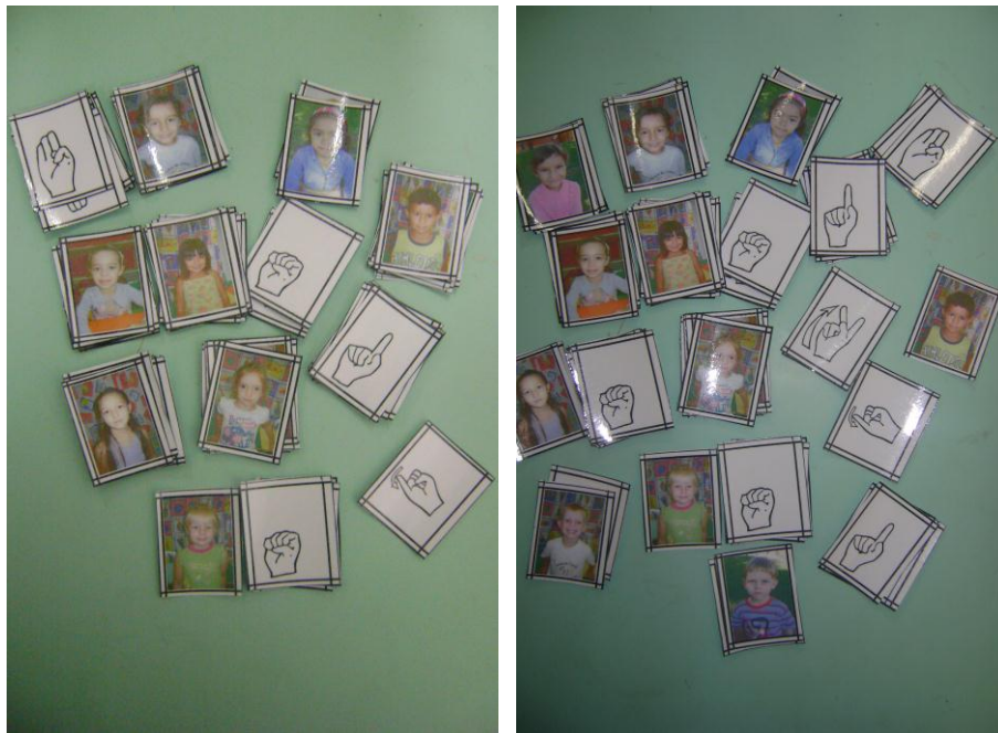
Jogos confeccionados em LIBRAS

- Também em anexo um CD com um Vídeo onde mostra mais detalhes sobre o trabalho.