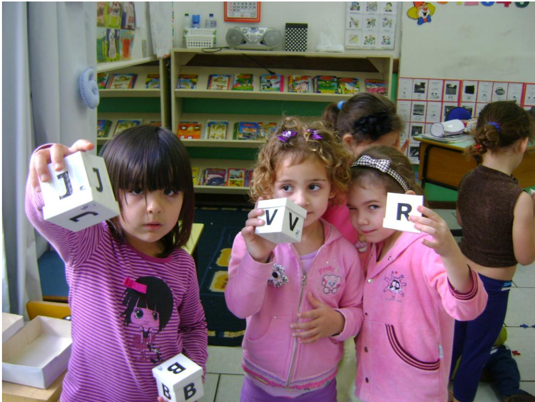
Adaptação de jogos com a LIBRAS.