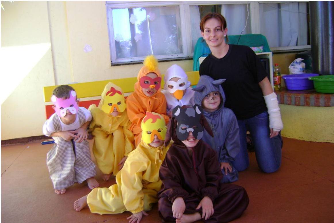
Apresentação do Teatro da Galinha Ruiva , trabalhado em sala de aula e adaptado para a LIBRAS.