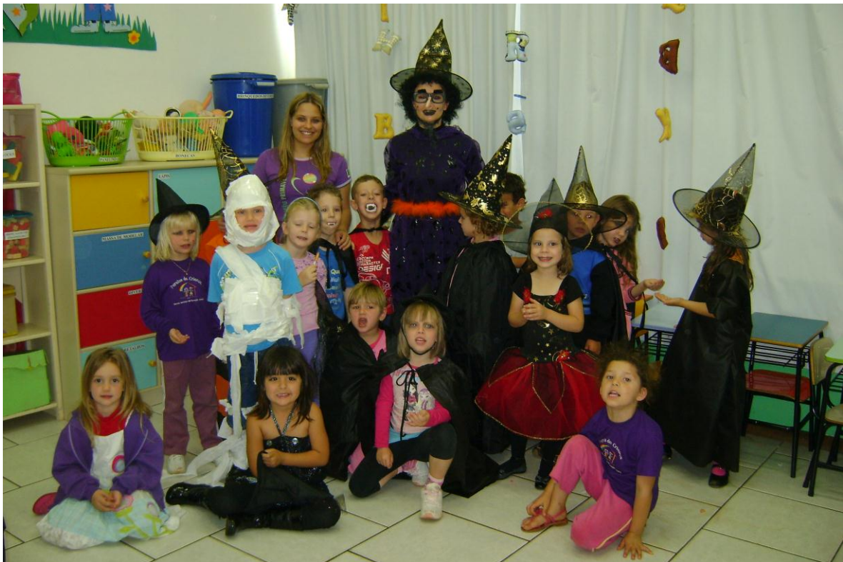
Hora do conto no Dia das Bruxas.