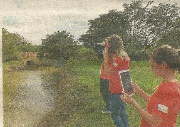
EQUIPAMENTOS: tablets são ferramenta de trabalho