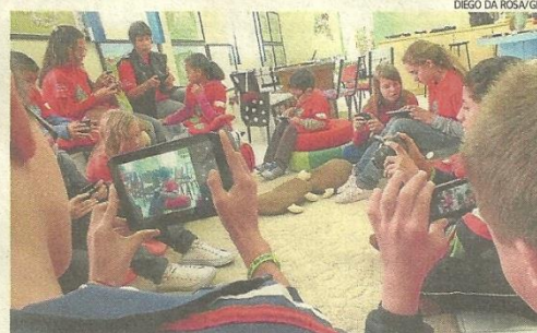
25 DE JULHO: estudantes registram o município

VEJA REPORTAGEM EM VÍDEO NO jornalnh.com.br