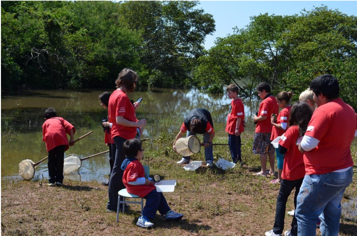
Alunos em áreas de banhados coletando macroinvertebrados.