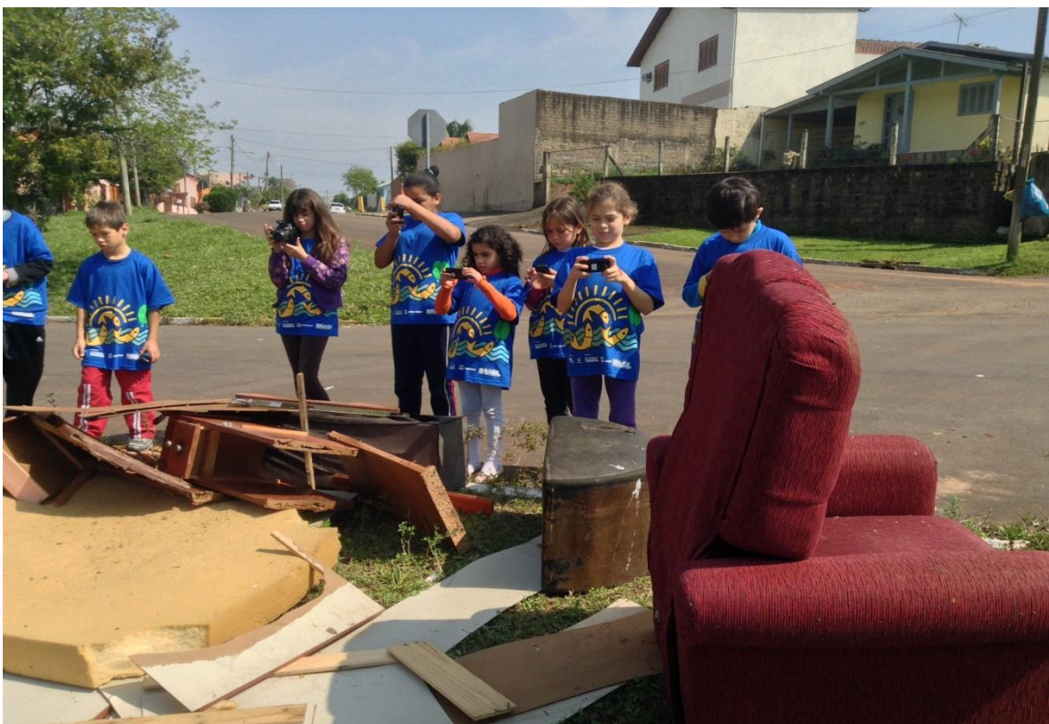
Alunos fazendo registro de depósito de lixos em áreas irregulares.