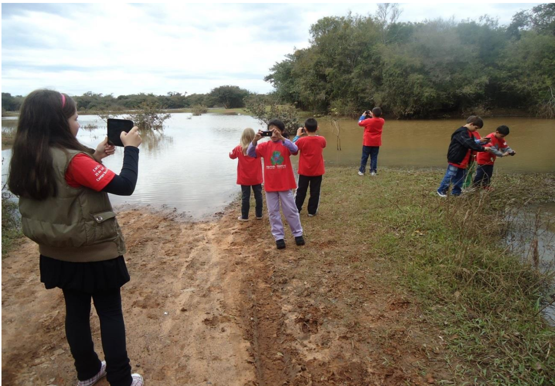
Observar, registrar, discutir... Aprender sobre as funções dos banhados