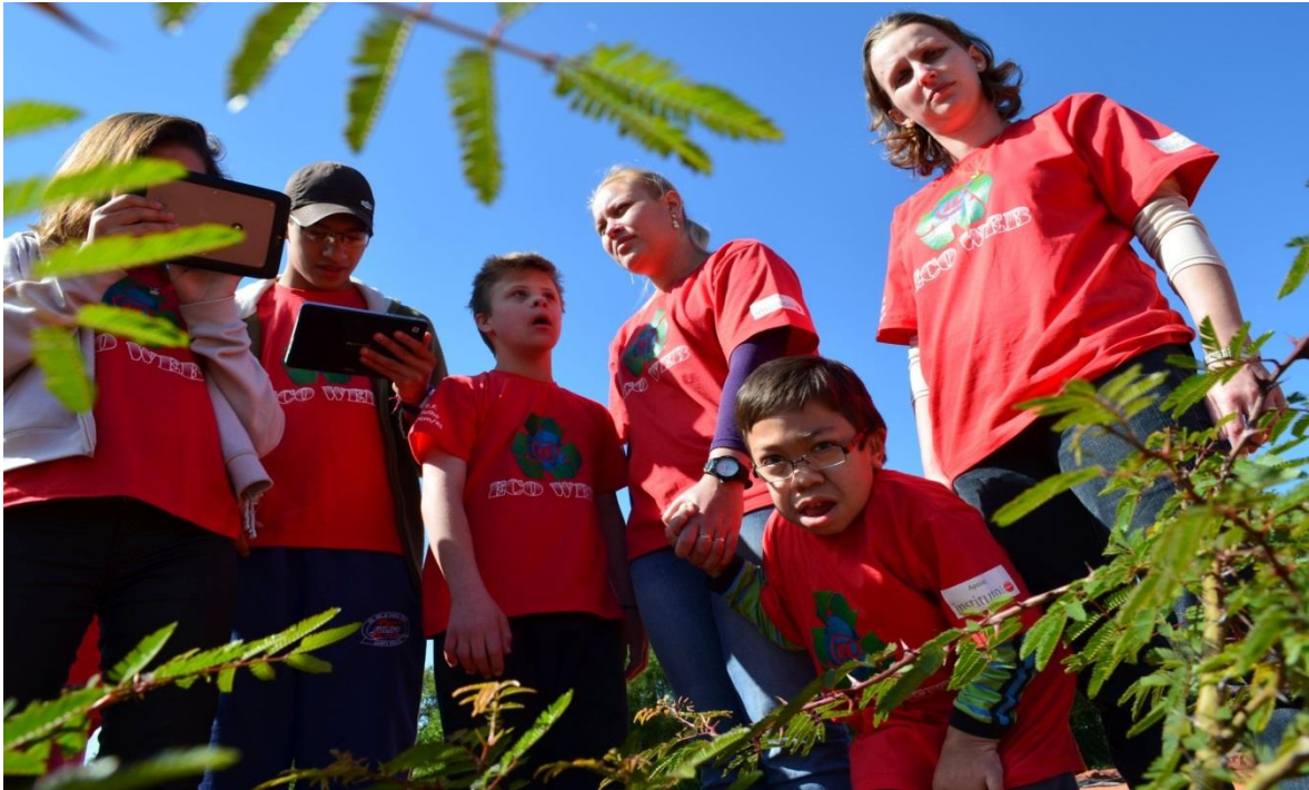
Alunos em campo conhecendo plantas bioindicadoras de áreas de banhado