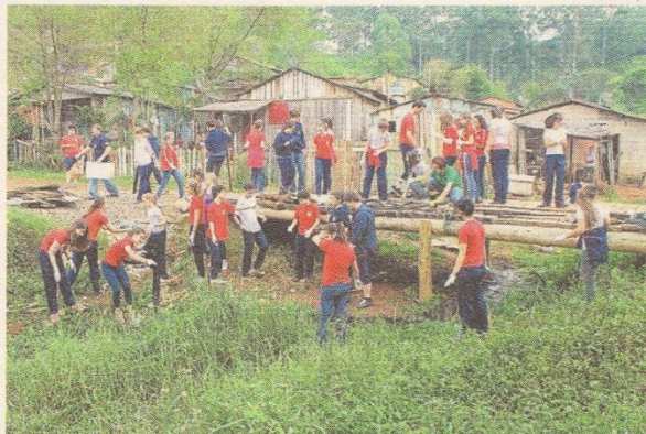
COLETA: estudantes captam imagens e trocam experiências no espelho d'água