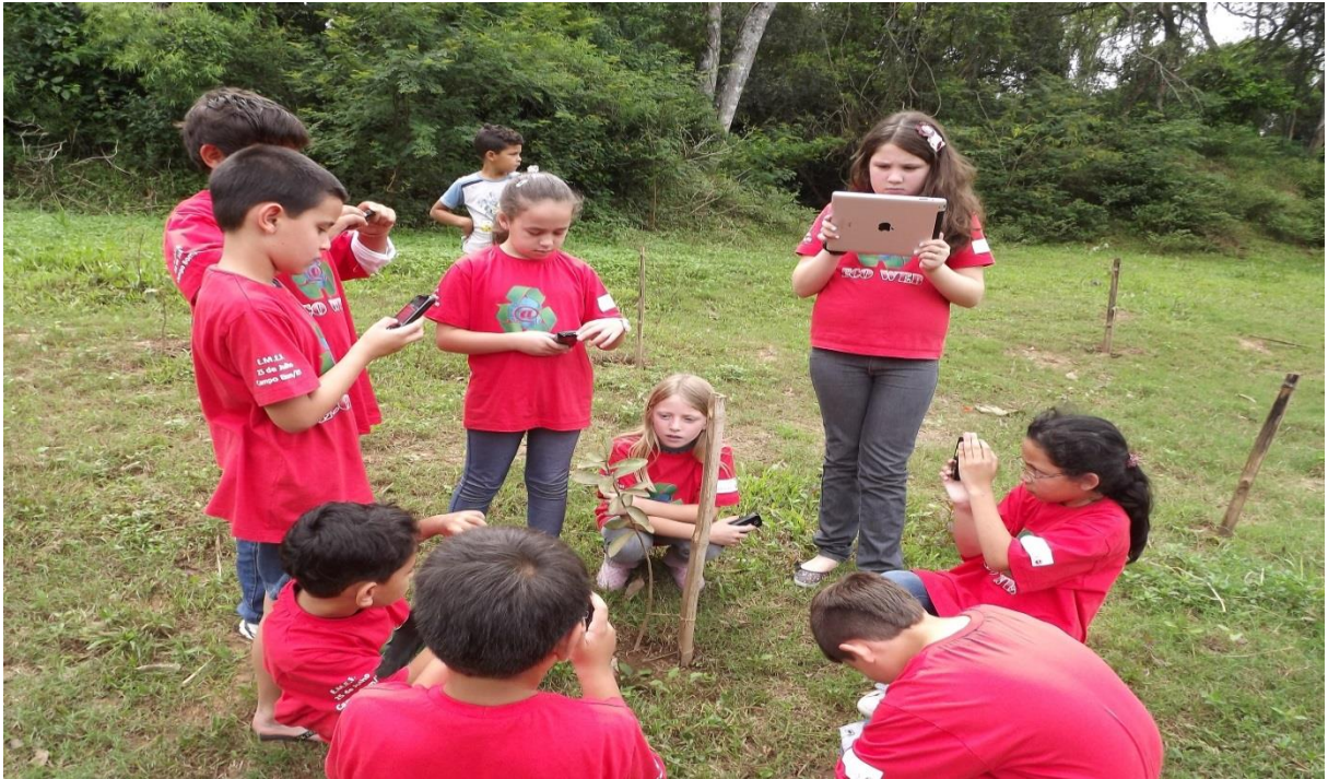
Alunos fazendo o acompanhamento das mudas de árvores nativas plantadas na margem do Arroio Schmidt